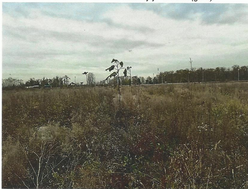
Sl.br. 3 (gore) i 4.: Dio čestica na kojima je posađena paulovnja (dolje)