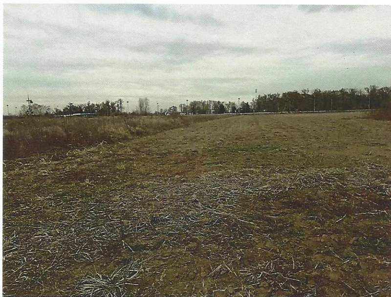
Sl.br. 2: Dio k.č.br. 2041/2 koji je oranica (gore)