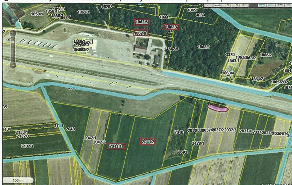
Slika br. 1: Makrolokacija čestica u stečajnom postupku

Katastarske čestice 1862/6, 1862/7 i 1862/8 u zemljišnim knjigama upisane su kao šume. Većim dijelom čestice su obrasle sa samoniklom šumskom vegetacijom, gustim grmljem, manjim dijelom mladim drvećem i pojedinačno se mogu vidjeti starija stabla topole i hrasta. Čestice su u cijelosti ograđene armaturnom mrežom („mata“) i drvenim stupovima (slika br. 5). Na dijelu k.č.br. 1862/6 i 1862/8 nalazi se prostor na kojem se uzgajaju crne slavonske svinje. Nema izgrađenih objekata. Do čestica postoji asfaltirani pristupni put.