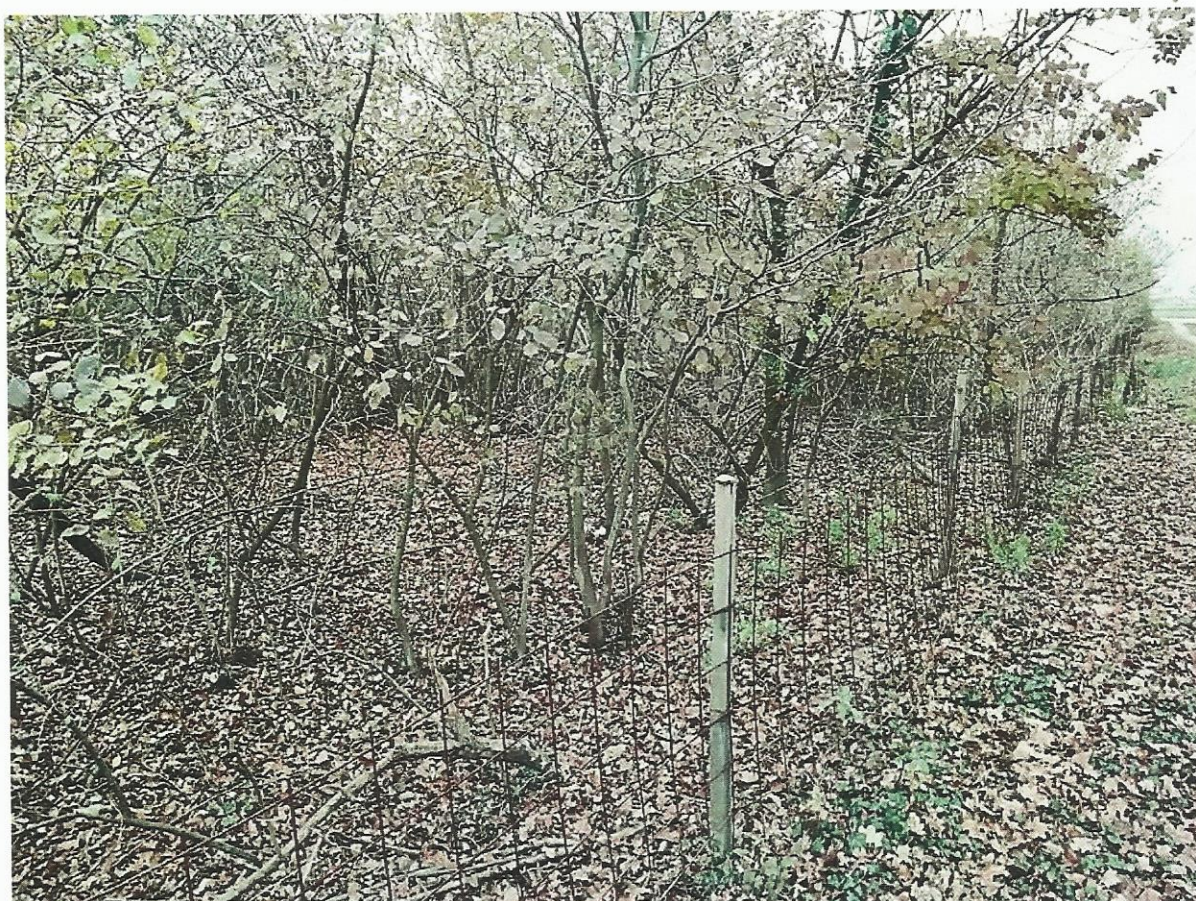
Sl.br.5: Dio čestica na kojima se nalazi šuma